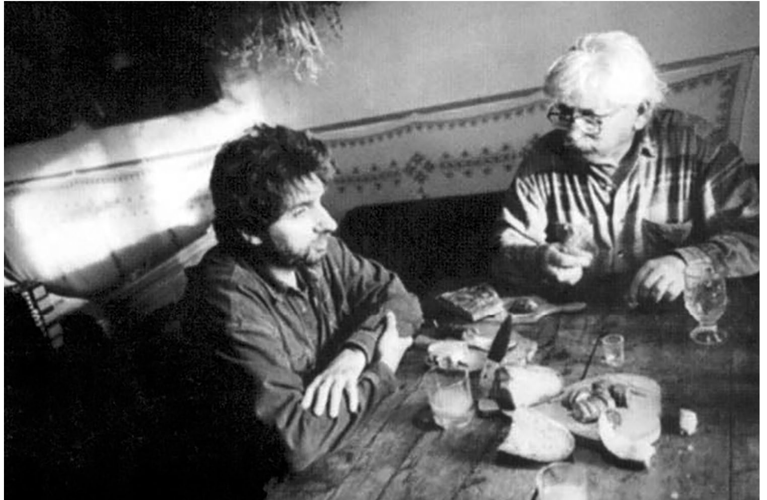
Sčuchli jsme se, jak dva psi

Sčuchli jsme se, jak dva psi, pravil mi kdysi. A co mám z našeho psovského kamarádství teď psát o starém psu? Nejsme oba žádná ušlechtilá a přešlechtěná plemena. Normální, zdravě křížení venkovští ořeši. Běháme spolu po koutech nezajímavých pro městská plemena, očucháváme všelijaké dědinské uličky, dřevěné kolně, stodoly, zahrady, les, kameně, stromy, trávu, kaluže, potok. Jíme a pijeme, co nám kdo dá, či na co narazíme cestou, nebo si ulovíme. Nejsme vybíraví. Ale potěší nás klobáska,